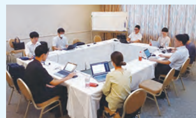
合宿総合実習風景